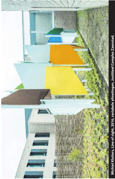
Michiel Kluiters, Line of sight, 2016, variabele afmetingen, Justitieel Complex Zaanstad.

sluiten in een enorm gebouw dat door zijn hoge torens er ook nog eens voor zorgt dat de gedetineerden zelfs het contact met de maatschappij verliezen. Hierdoor zouden de gedetineerden minder makkelijk bezock kunnen ontvangen, zowel van hun familie en vrienden als van hun advocaat of hulpverleners. Door gedetineerden te isoleren wordt het voor hen nog moeilijker om terug te keren naar de maatschappij en de middelen, zover van ze af staat.