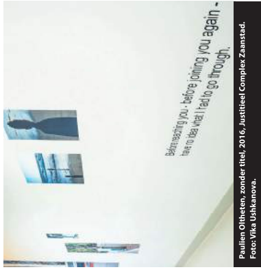
Paulien Olltheten, zonder titel, 2016, Justitieel Complex Zaanstad.

Geen praatje meer Dezelfde kritiek zou je kunnen leveren op het Justitieel Complex Zaanstad: het gebouw staat ver buiten de stad, op een industrieterrein en wordt demonstrieel van de buitenwereld afgeschermd door middel van een grote muur. Inmiddels is het thema zorg verdwenen uit de kernbegrippen van het ontwerp. Nu staan de begrippen humaan, sober, doelmattig en robuust centraal. Bovendien is het regime onpersoonlijk er geworden, door de invoering van een geautomatiseerd passiesysteem is zelfs een praatje met een bewaarder niet meer vanzelfsprekend. Activiteiten en sociale connecties worden nu een minimum beperkt waardoor de gekleinere meer uren in zijn cel zal doorbrengen. Hoewel het gevangenisstelsel niet geschikt is voor kleinschalige begeleiding, reïhabilitatie en reïhabilitatie is er vanuit de samenleving en de politiek, weinig