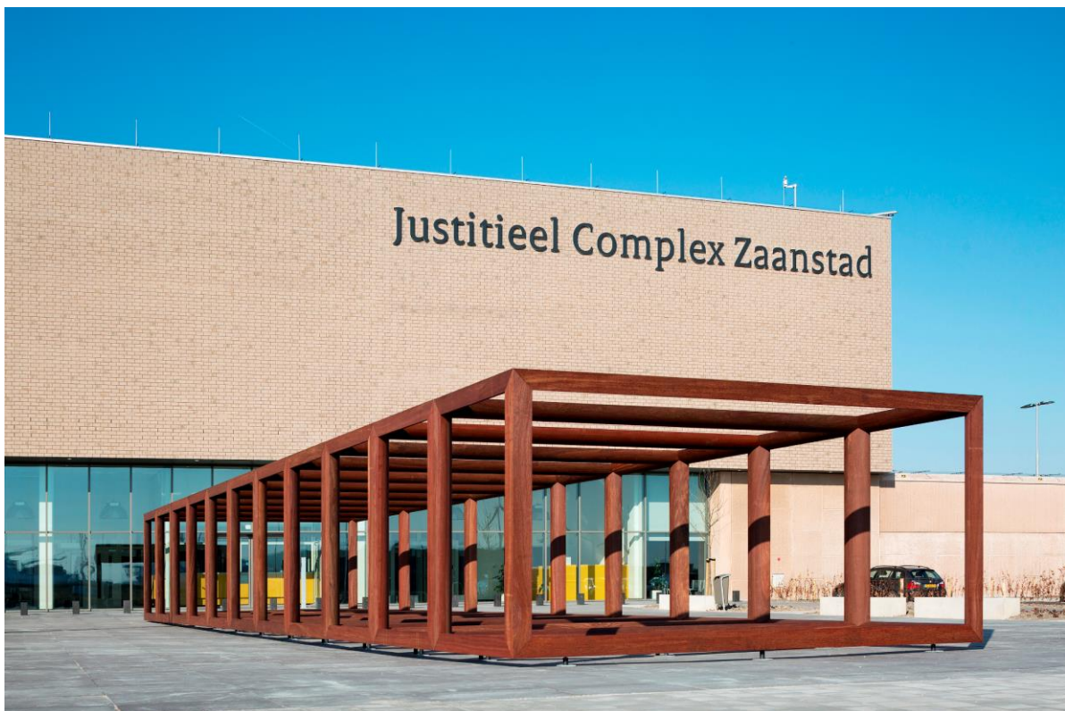
Afb. 2. Lucas Lenglet, The air we breathe , 2016, rood ijzerhout, verzinkt staal, nylon, 2452 x 275 x 567 cm., Justitieel Complex Zaanstad.

Voor de ingang van het Justitieel Complex Zaanstad staat de imposante sculptuur The air we breathe , van kunstenaar Lucas Lenglet. Het werk is te zien voor de mensen die het complex bezoeken. De sculptuur geeft de buitenstaander een blik op de architectuur en het functioneren van de binnenkant van het gebouw. Voor Lenglet was het belangrijk om te laten zien wat er binnen in dat hermetisch afgesloten gebouw gebeurt. De strakke blinde gevel zegt namelijk niet