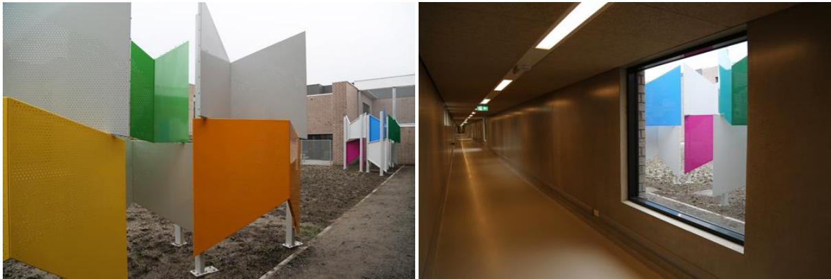
Afb 5 en 6. Michiel Kluiters, Line of Sight , 2016, variabele afmetingen, Justitieel Complex Zaanstad.

Kunstenaar Michiel Kluiters maakte het werk Line of Sight voor het Justitieel Complex Zaanstad. De opdracht die hij kreeg van het consortium PI2 kwam voort uit een probleem dat binnen de architectuur van het gebouw niet was opgelost: de ramen met zicht op de binnentuinen van de psychiatrische afdeling van het complex zouden de gedetineerden ook zicht geven op elkaar. Gedetineerden op deze afdeling zouden wellicht angstig, geprikkeld of gefrustreerd kunnen raken wanneer zij een medebewoner op zijn cel kunnen zien, of het gevoel hebben bekeken te worden door een medegedetineerde. Aan Kluiters werd gevraagd dit foutje in de architectuur op te lossen: een interessante opdracht waarin kunst probleemoplossend kan werken, vond Kluiters. Verder was de opdracht die de kunstenaar kreeg heel open: het kunstwerk kon iets zijn dat de zichtlijnen afsnijdt, maar ook iets dat de aandacht van het uitzicht zou afleiden. Hierop ontwierp hij objecten voor de binnentuinen die als doel hebben de ramen af te schermen om zodoende de zichtlijnen tussen de ramen die uitkijken op de tuin te doorbreken.