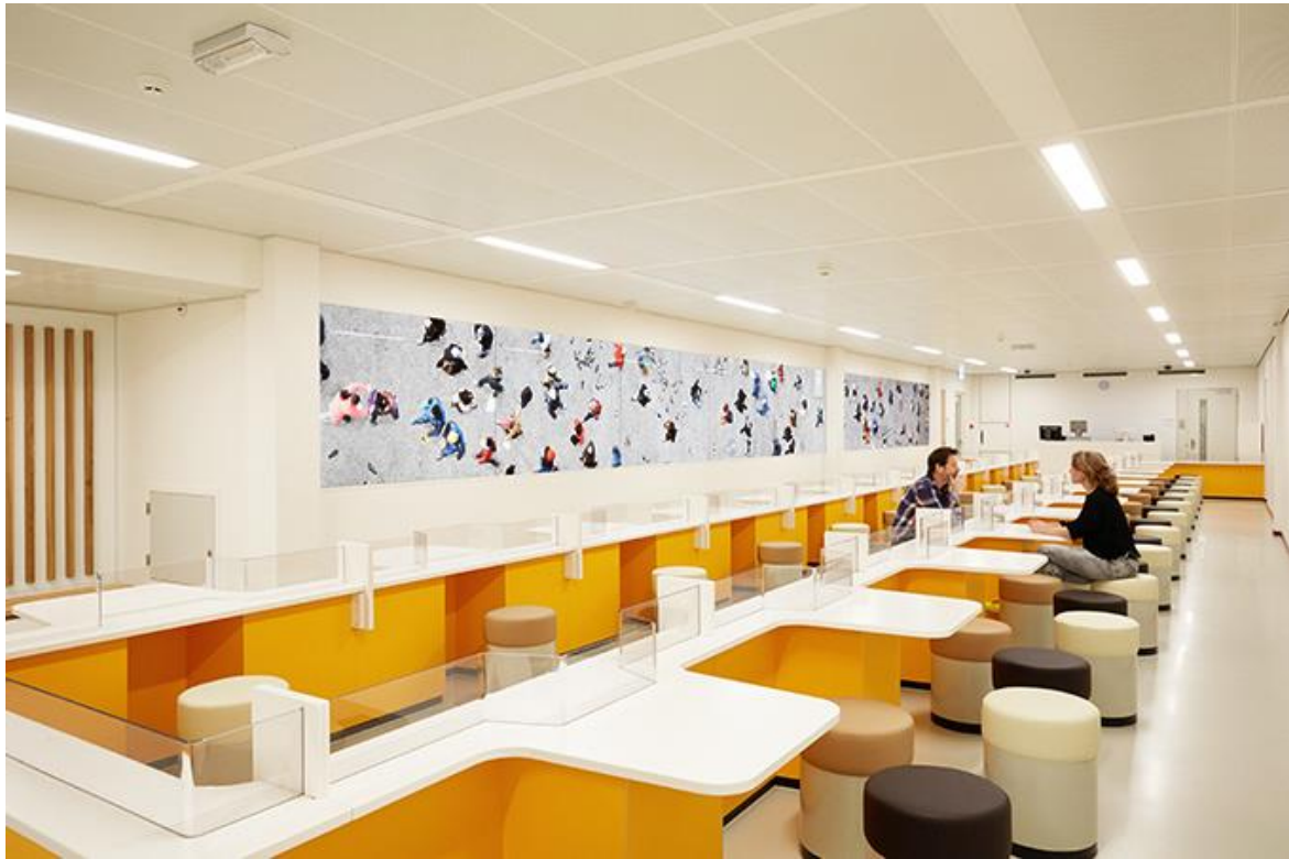
Afb. 3. Katrin Korfmann, zonder titel , 2016, glas, fotografische print, vier werken van: 1,5 m x 17 m, Justitieel Complex Zaanstad.

Kunstenaar Katrin Korfmann maakte vier fotocollages van zeventien meter voor de vier bezoekersruimtes die het Justitieel Complex Zaanstad rijk is. In de bezoekersruimtes kunnen de gedetineerden hun familie en vrienden ontmoeten. Het is een beladen ruimte, waar vaak moeilijke gesprekken moeten worden gevoerd en waar de gedetineerde geconfronteerd wordt met wat hij mist. Korfmann probeert een stukje van de buitenwereld naar binnen te brengen in de penitentiaire inrichting.